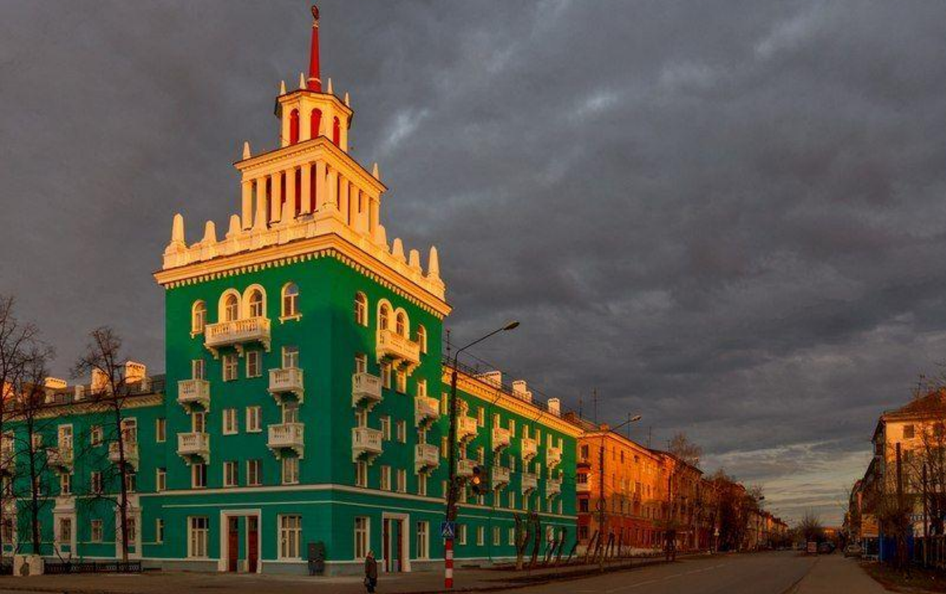
Дом со шпилем