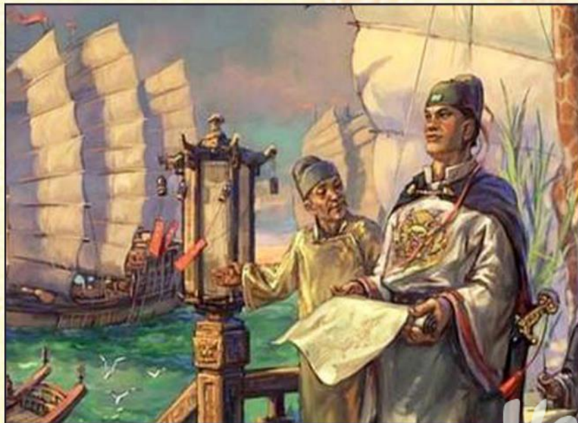
Китайский купец везет чай в Россию морем

Благодаря этой истории европейцы смогли разводить чай.