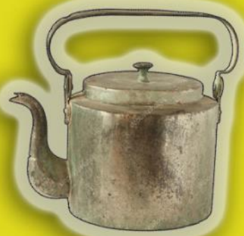
солдатский чайник времен ВО войны

На плите стоит-пытит, В нем вода бурлит кипит Из под крышки выйдет пучка, Носик есть, а сбоку ручка. Чашек чайных всех начальник Называется он...чайник!