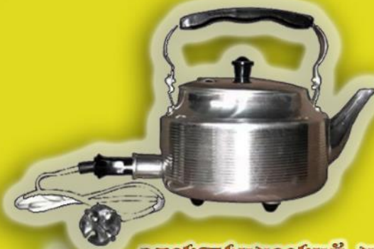
электрический чайник прошлого века