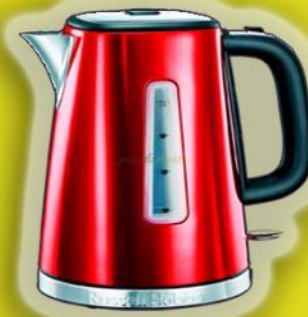
современный электрический чайник

На плите стоит-пытит, В нем вода бурлит кипит Из под крышки выйдет пучка, Носик есть, а сбоку ручка. Чашек чайных всех начальник Называется он...чайник!