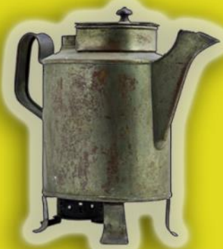
походный чайник начало 19 в.