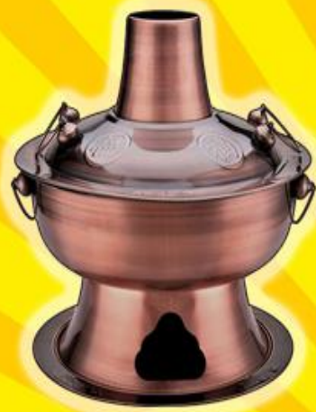
Китайский самовар Хого

На самом деле приборами, отдалённо напоминающими самовар, пользовались ещё древние римляне. Современный русский самовар похож на старинный китайский хого, древнеримскую аутпенсу, и иранскую жаровню - он имеет имеющее и трубу, и поддувало.