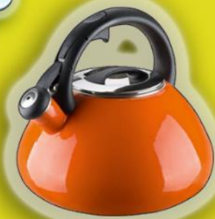
чайник со светлом