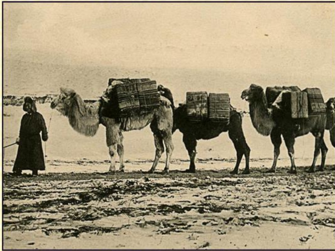
Путь чая из Китая в Россию

Китайские купцы продавали чай в другие страны. Чай стал любимым напитком в большинстве стран мира, но выращивать его долгое время не умели и привозили из Китая.