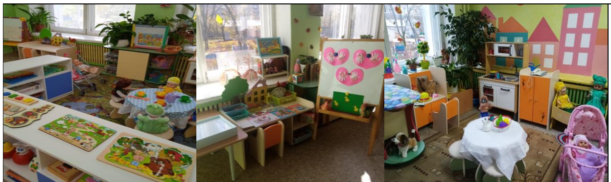
Вторая группа раннего возраста (с 2-х до 3-х лет)