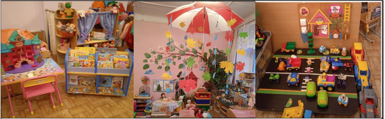
младшая группа (с 3-х до 4-х лет)