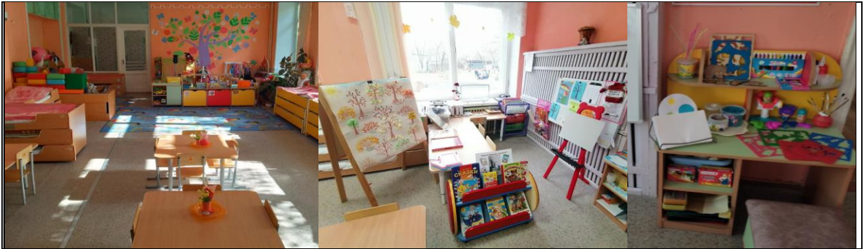
средняя группа (с 4-х до 5-ти лет)