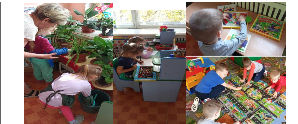
Подготовительная к школе группа (с 6-ти до 7-ми лет).