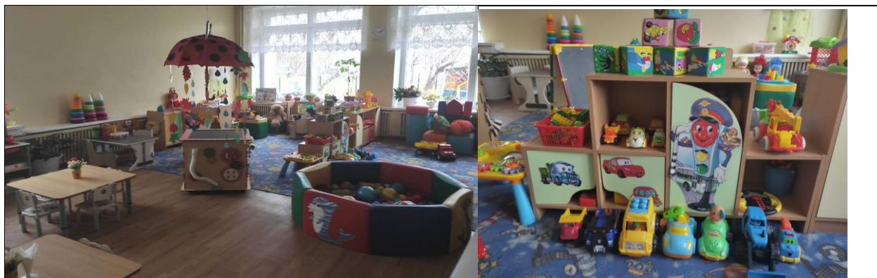
Первая группа раннего возраста (с 1,6 до 2-х лет);

Группы оснащены детской мебелью, комплектами игровых модулей, пособиями для полноценного развития детей с учетом их возрастных особенностей и интересов. 2 группы оснащены интерактивным оборудованием. Оборудование групповых помещений соответствует возрастным особенностям детей. Созданная развивающая предметно-пространственная среда отвечает требованиям ФОП ДО. Подбор оборудования осуществляется в соответствии с ОП ДО МБДОУ «Детский сад № 100».