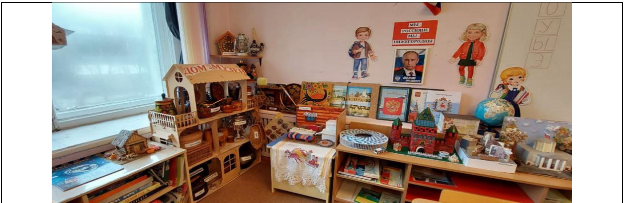
Старшая группа (с 5-ти до 6-ти лет);